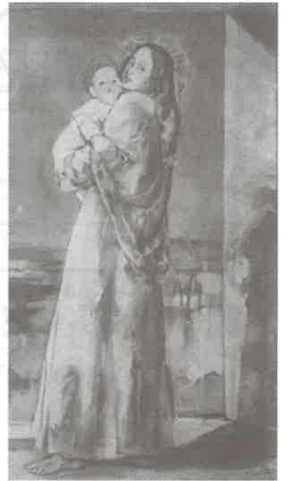
A MARIA, STELLA DELL'EVANGELIZZAZIONE

O Maria, al mattino della Pentecoste, Tu hai sostenuto con la preghiera l'inizio dell'evangelizzazione, intrapresa dagli apostoli sotto l'azione dello Spirito Santo.