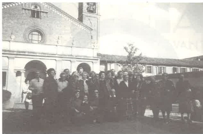
Nella foto il gruppo dei gitanti in sosta di fronte all'abbazia di Chiaravalle