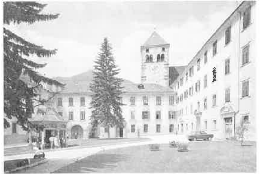
Nelle foto: sopra l'Abbazia di Novacella presso Bressanone; a sinistra il paese di Lutago in val Aurina; sotto una veduta di Mereta presso Vipiteno.

La quota comprende: Viaggio ed escursioni in autopullmann GT. Sistemazione in Hotel *** in camere a due letti con servizi e tv. Pensione completa dal pranzo del 1° giorno al pranzo dell'ultimo (bevande incluse in Italia). Escursioni come da programma. Ingresso al Linderhof. Pranzo al sacco nell'escursione di Linderhof. La quota non comprende: Extra, eventuali visite a pagamento (eccetto Linderhof), guide. Supplemento camera singola: lire 100.000 Documento necessario: Carta d'Identità valida per l'espatrio. Guida se richiesta: lire 5.000 (mezza giornata); lire 10.000 (giornata intera).