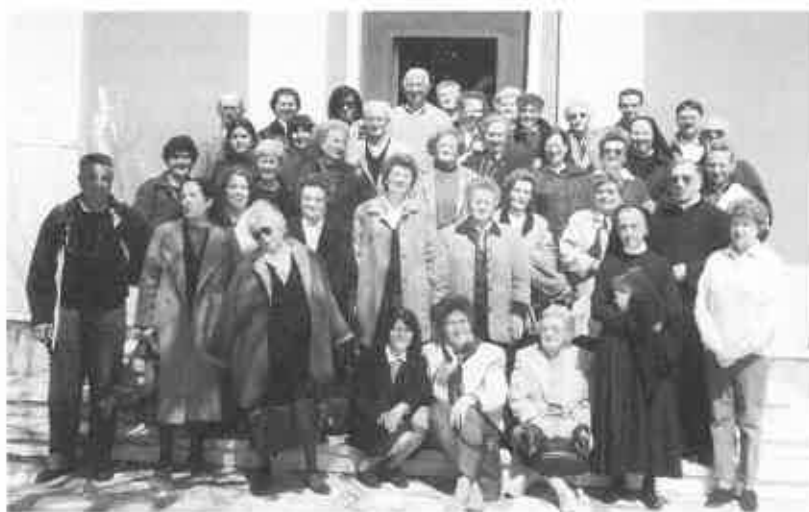
Ricordando la giornata del 25 Aprile u.s. a Cardini.