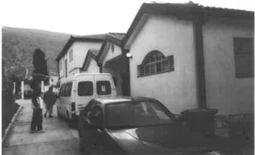
CONSEGNA ALL'ASILO DEGLI ORFANI DI GUERRA

Siamo venuti a conoscenza che qui la gente campa con l'equivalente di 50 euro al mese (una pensione minima),