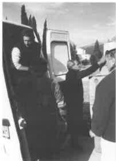
ARRIVO A MOSTAR: CONSEGNA ALL'ISTITUTO INVALIDI DI GUERRA (OSPEDALE MUSULMANO)

rietà, immerso in questa realtà tanto contraddittoria, giungiamo a destinazione e consegniamo quanto il buon cuore di tante persone ha saputo donare; un quantitativo di circa 20 quintali (7 dalla nostra zona e 13 dalla Caritas di Finale Emilia) in pasta, farina riso, zucchero, olio, latte, biscotti, scatolame, dolciumi, vestiario e altre cose utili alle comunità presso cui ci siamo recati, un Istituto di Invalidi di Guerra (Ospedale Musulmano), una Casa per anziani, un Asilo per orfani (circa quaranta bambini).