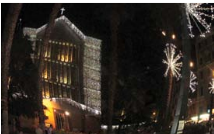
processione per la Festa del Patrono S. Antonio